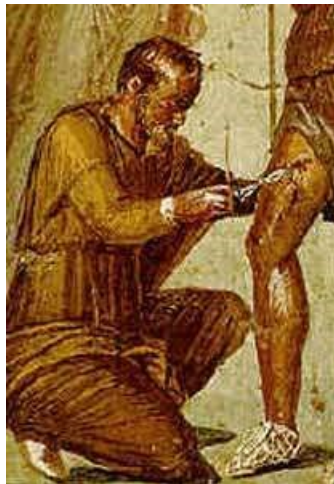
Rzymski fresk przedstawiający lekarza udzielającego pomocy medycznej