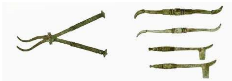
Rzymskie przyrządy medyczne. Powyżej kościane kleszcze oraz kościane podważniki