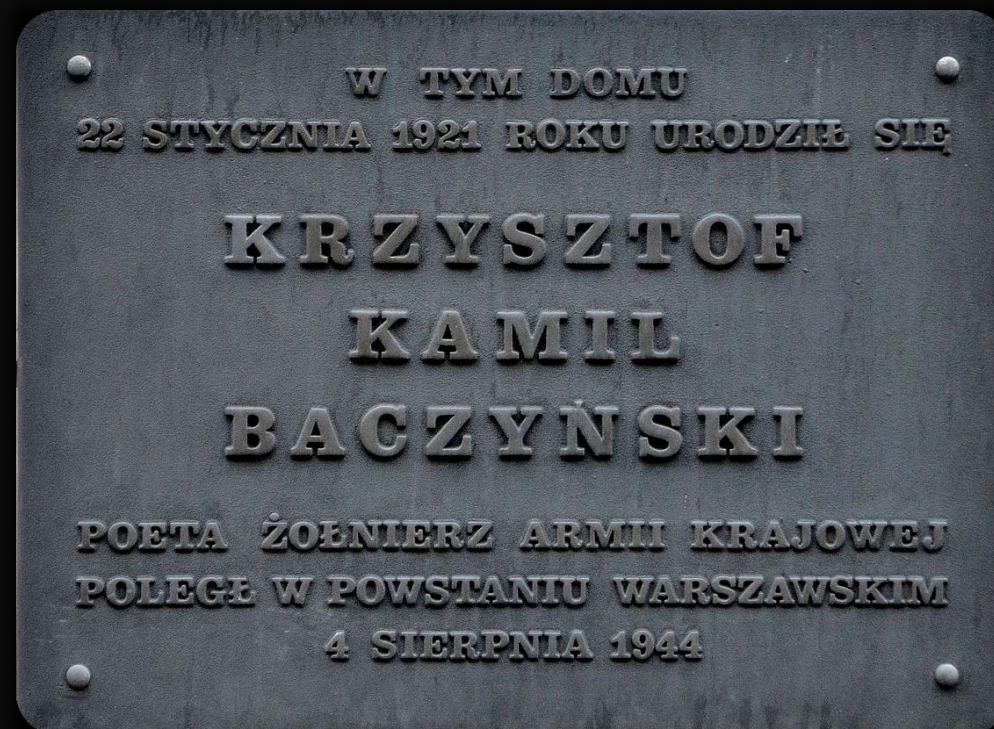
Tablica pamiątkowa na budynku przy ul. Bagatela 10 w Warszawie, w którym urodził się Krzysztof Kamil Baczyński.