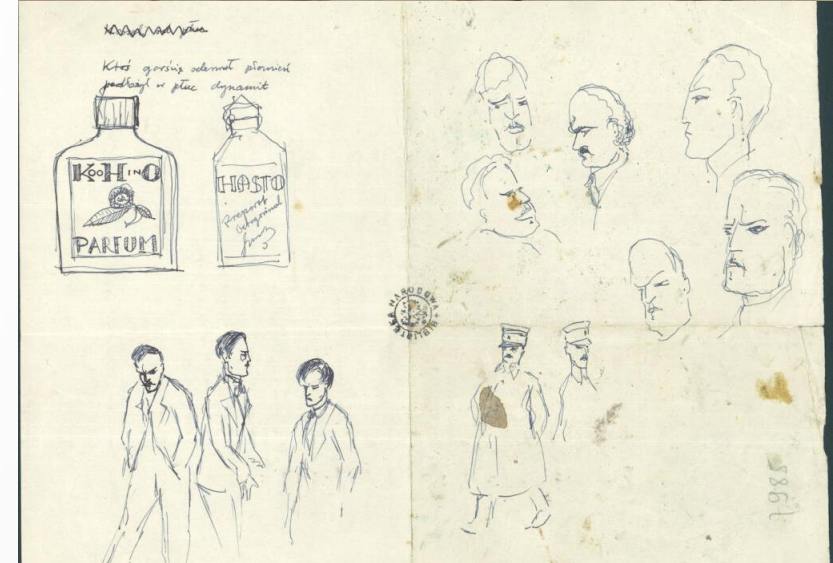
Prace plastyczne K. K. Baczyńskiego